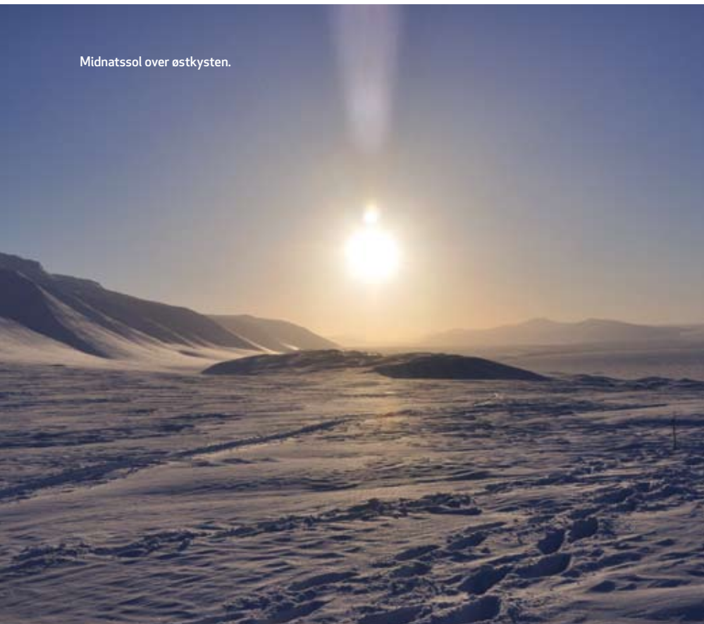
Midnatssol over østkysten.

» vejr i cirka 16 timer, og de timer skulle bruges til fulde. Vi besluttede os for at fortsætte ned langs kysten, rundt om den næste pynt og så op af 'Ulvebreen' og ned på den anden side.