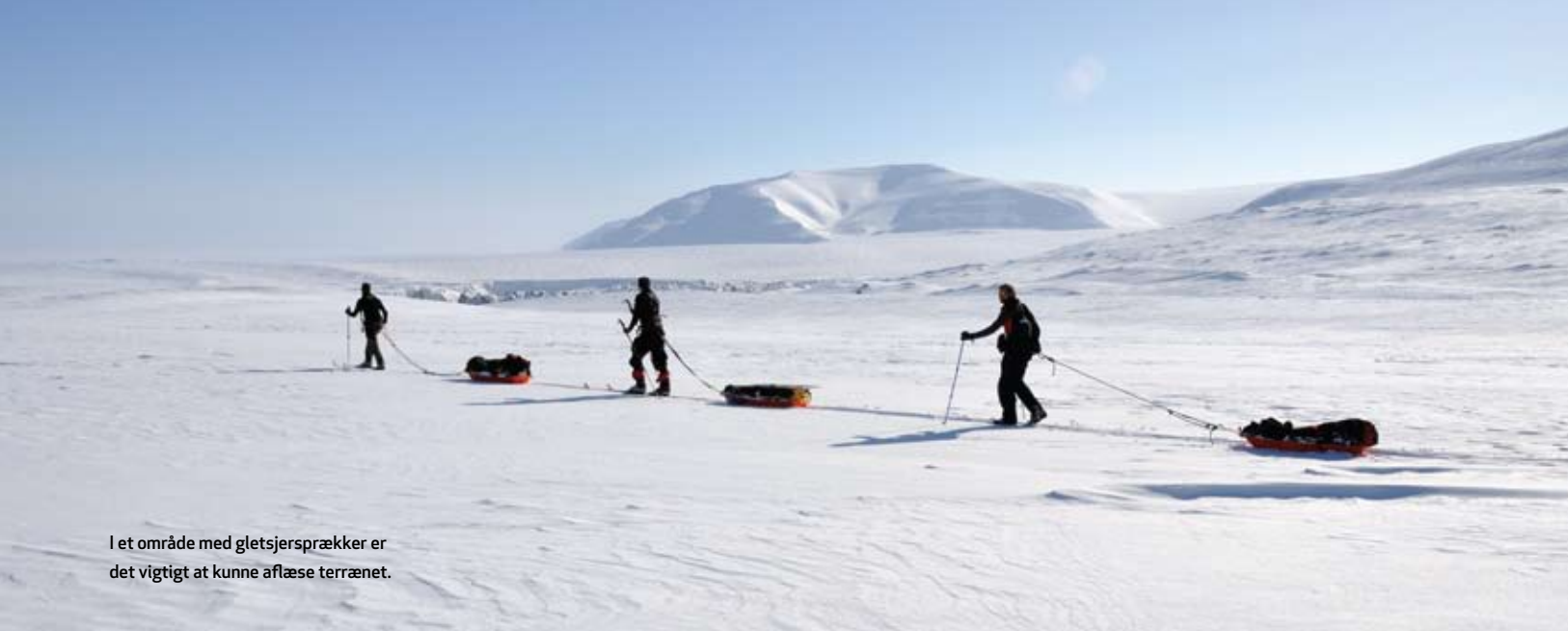
I et område med gletsjersprækker er det vigtigt at kunne aflæse terrænet.

“NÅR MAN BOR I EN VERDEN, HVOR STORT SET ALT ER KORTLAGT OG GJORT FØR, SÅ SKAL DER ARBEJDES LIDT MED BEGREBET ‘EVENTYR’.”